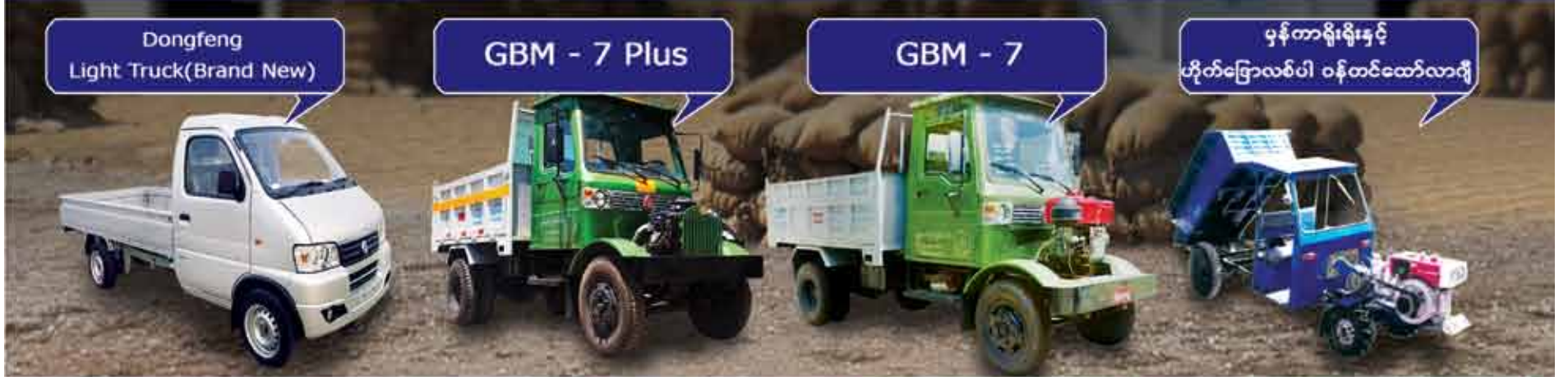
Dongfeng Light Truck (Brand New)

လက်ငင်းစနစ်၊ ဘက်အရစ်ကျစနစ်ဖြင့်ဝယ်ယူနိုင်ပြီး အပို့ပစ္စည်းများကို အမြဲဖြည့်အနယ်နှယ်ရှိကုမ္ပဏီခွဲများတွင်ဝယ်ယူရရှိနိုင်ပါသည်။ ရွေးနှုန်းသက်သာပြီးဝယ်ယူသူများအဆင်ပြေစေရန်ဝန်ဆောင်မှုများကို အကောင်းဆုံးဆောင်ရွက်ပေးပါသည်။