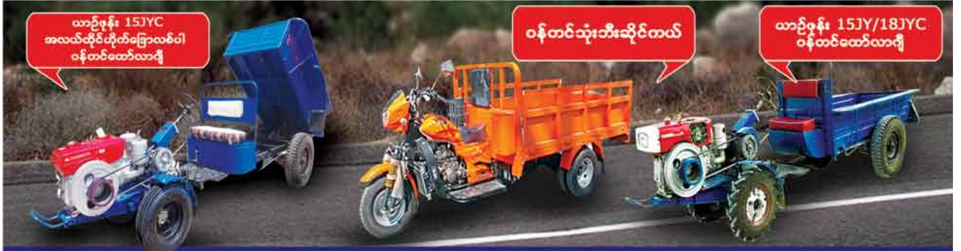
ယာဉ်စုန်း 15JYC အလယ်တိုင် ဟိုက်ဒြောလစ်ပါ ဝန်တင်ထော်လာရီ