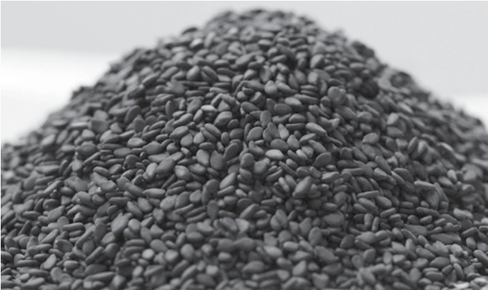
မုံရွာဆီထွက်သီးနှံဈေးကွက် နှမ်းနက်တစ်မျိုးသာ ဈေးမာ

မုံရွာကုန်စည်ဒိုင် ဩဂုတ်လ လကုန်ပတ် ဆီထွက်သီးနှံဈေးကွက်မှာ တရုတ်ဝယ်လိုအားရှိတဲ့ နှမ်းနက်တစ်မျိုးသာ ဈေးမာခဲ့သလို အရောင်းအဝယ်လည်း သွက်ခဲ့တယ်လို့ သိရပါတယ်။ ယခုတစ်ပတ်အတွင်း နှမ်းမျိုးစုံဈေးကွက်မှာ နှမ်းဖြူ တစ်တင်း ကျပ် ၃၀၀၀၀ မှ ၃၁၀၀၀ အတွင်း ပေါက်ဈေးဖြစ်ခဲ့ပြီး တစ်ရက် အိတ် ၁၀၀ ခန့် နှမ်းညို(သစ်)ဟာ တစ်တင်း ၂၃၅၀၀ မှ ၂၄၃၀၀ ကျပ်အတွင်း ပေါက်ဈေးဖြစ်ခဲ့ပြီး တစ်ရက်အိတ် ၁၀၀ ခန့်သာ အရောင်းအဝယ်ဖြစ်ခဲ့ပေမယ့် နှမ်းနက်ကတော့ တရုတ်ဝယ်လက်ရှိလို့ တစ်တင်းကျပ် ၅၀၀၀၀ ဝန်းကျင်မှာ ဈေးမာခဲ့သလို တစ်ရက်အိတ် ၂၀၀ မှ ၃၀၀ ကြား အရောင်းအဝယ်သွက်ခဲ့တယ်လို့ ဒိုင်ရပ်ကွက်က သိရပါတယ်။