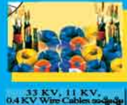
33 KV, 11 KV, 0.4 KV Wire Cables အမျိုးမျိုး