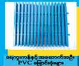
မရေညှက်နှင့် အဖောက်အစည်း PVC ခြေခံများ