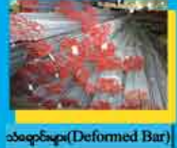
သစ်ဆွဲများ (Deformed Bar)