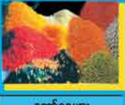
တောင်ခေများ