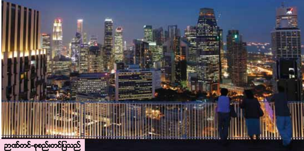
ဉာဏ်တင်-ခုစည်းတင်ပြသည့်

အမေရိကန်ဒေါ်လာတန်ဖိုးဖြင့်တက်မှု၊ ငွေတန်ဖိုးချမှုနဲ့ ရေနံစိမ်းနဲ့ ကုန်စည်ဈေးတွေ ကျဆင်းမှုကြောင့် ကမ္ဘာတစ်ဝန်းရှိ ကုန်ကျစရိတ်တွေ အဆ မတန်မတည် မငြိမ်ရုံနေဆဲဖြစ်ကြောင်းလည်း စစ်တမ်းမှာ ဖော်ပြထားပါတယ်။