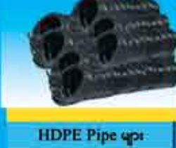
HDPE Pipe များ