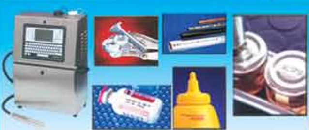
လုပ်ငန်းသုံး Inkjet Printer