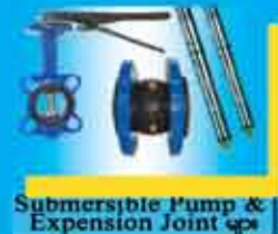
Submersible Pump & Expansion Joint များ