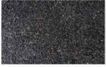
Black Sesame seeds