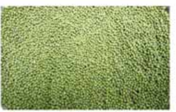
Green Mung Bean (Wakema)