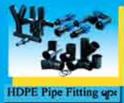
HDPE Pipe Fitting များ