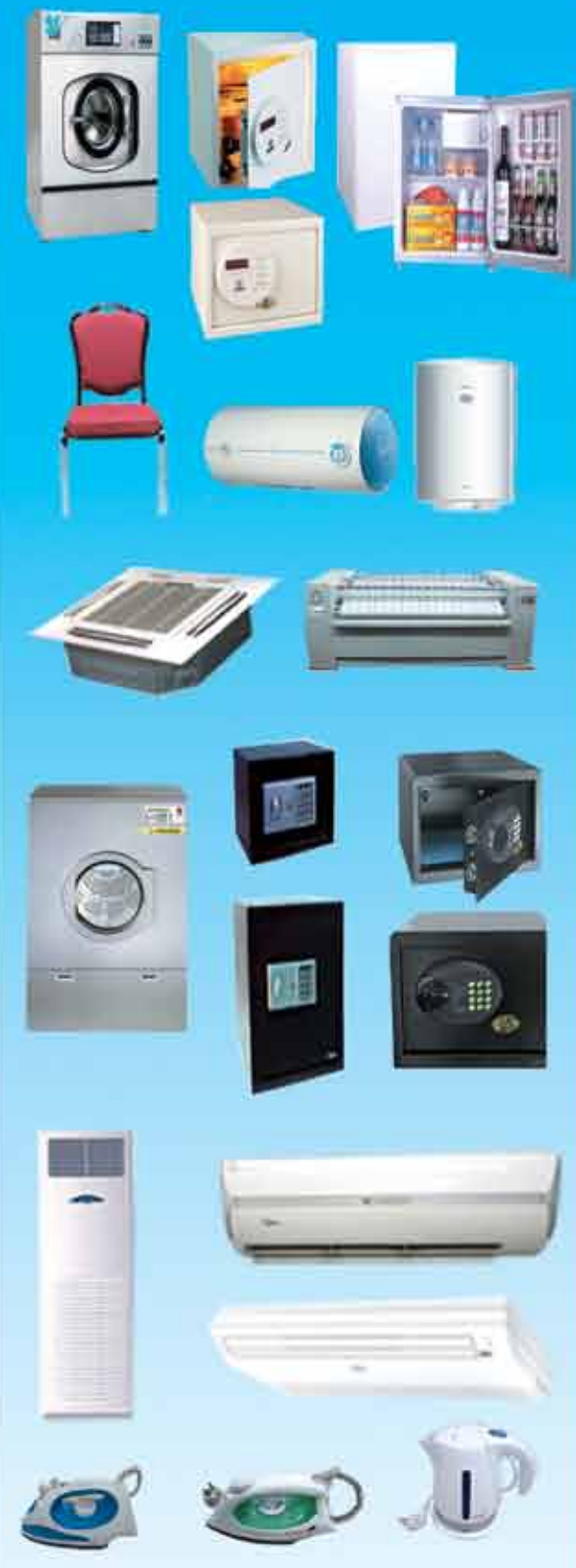
Hotel နှင့် အိမ်သုံး Kyoto Electronic အမျိုးမျိုး