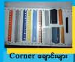
Corner ချောင်းများ