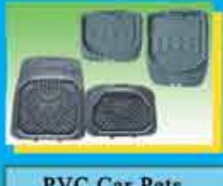
PVC Car Mats