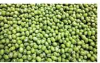
Green Mung Bean (Polished)