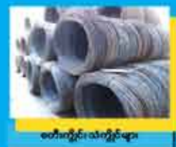
စတီးလ်ဘီး၊ သံတံဘီးများ