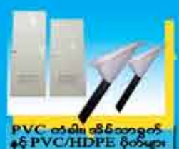
PVC သံမဏိ၊ သံမဏိအားပျက်နှင့် PVC/HDPE ပိုက်များ