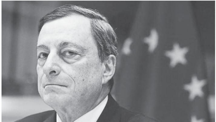
အီးစီဘီက စီးပွားရေးလုံခြုံရေးအားပေးရေး အစီအစဉ်များကို တိုးမြှင့်

ယူရိုငွေကြေးဖောင်းပွမှုနှုန်းကျဆင်းလာပြီး စီးပွားရေးအလားအလာကလည်း ဆက်လက်မိုးမှိန်နေတဲ့အတွက် ယခုရက်သတ္တပတ်မူဝါဒ အစည်းအဝေးမှာ ဥရောပဗဟိုဘဏ်က စီးပွားရေးလုံခြုံရေးအားပေးမှုအစီအမံသစ်များကို ဥရောပဗဟိုဘဏ် (အီးစီဘီ) ရဲ့ ကြေညာလေ့လာဆန်းစစ်သူတို့က ပြောကြောင်း အေအက်ဖ်ပီသတင်းမှာ ဖော်ပြပါတယ်။