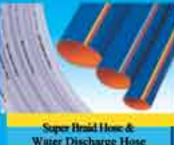
Super Braided Hose & Water Discharge Hose