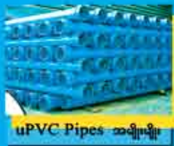
uPVC Pipes အမျိုးမျိုး