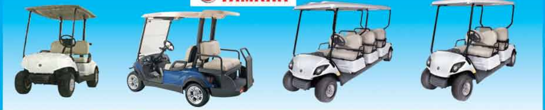
Multi Passenger & Personal Transportation Vehicle