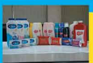
Imperial Leather Soap & Products