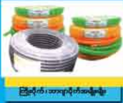
ဗြဲလိုက် အားပျက်အမျိုးမျိုး