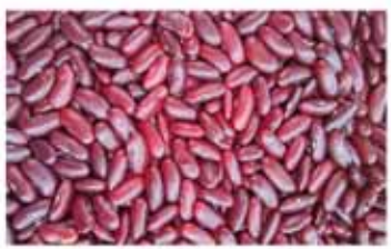
Red Kidney Bean