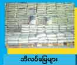
သံလက်ခြေများ