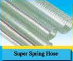
Super Spring Hose