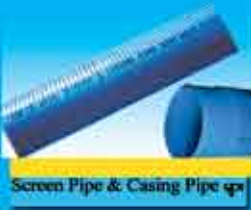
Screen Pipe & Casing Pipe များ