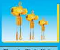
Electric Chain Hoist