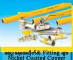
ဆေးဆေးဆိုင်နှင့် Fitting များ Nickel Coated Copper