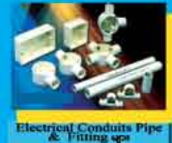
Electrical Conduits Pipe & Fitting များ