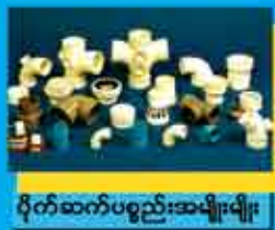
ပိုက်ဆက်ပစ္စည်းအမျိုးမျိုး