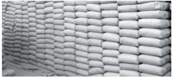
သီတာဝင်း (DOT) စုစည်းသည်

တောင်ကြီးဈေးကွက်မှာ ဘိလပ်မြေက ပွင့်လင်းရာသီကြောင့် အရောင်းအဝယ်ပုံမှန်ရှိပေမယ့်လည်း ဈေးငြိမ်နေတယ်လို့ သိရပါတယ်။ ဈေးကွက်ထဲ အရောင်းအဝယ်ဖြစ်နေတဲ့ ဈေးမှာ ဆင်(ထိုင်း) ၇၅၀၀ ကျပ်၊ စိန်(ထိုင်း) ၇၄၀၀ကျပ်၊ အေသုံးလုံး ၅၀၀၀ ကျပ်၊ အပါချီ ၅၀၀၀ကျပ်၊ ကမ္ဘောဇ ၄၆၀၀ကျပ်၊ နဂါး ၅၀၀၀ကျပ်နဲ့ အရောင်းအဝယ်ဖြစ်တယ်လို့ ဘိလပ်မြေအရောင်းဆိုင်မှစုံစမ်း သိရှိခဲ့ပါတယ်။