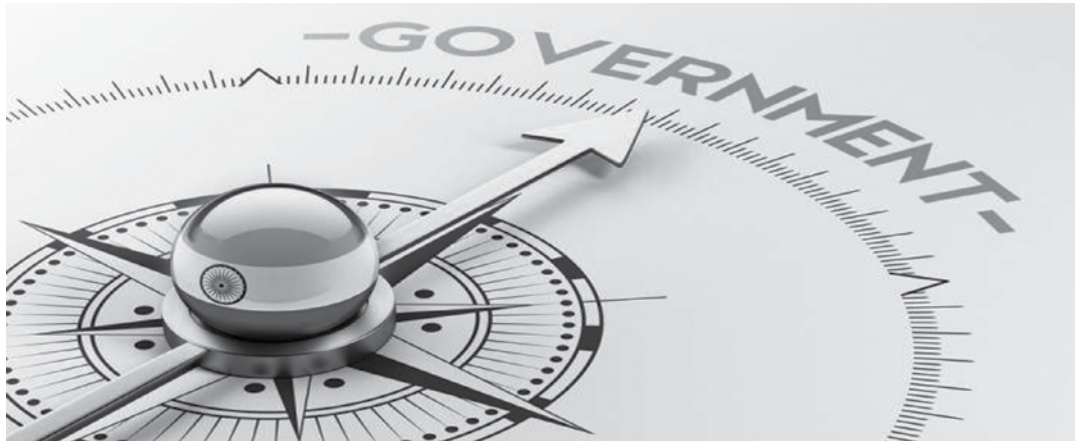
ရေးကို အပြည့်အဝ ဖော်ဆောင်နိုင် အောင်ကြိုးပမ်းဖို့ လိုအပ်ပါသည်။

ကြိုး ပမ်းဆောင်ရွက်ရတဲ့ ရည်ရွယ်ချက် က သမိုင်းကြောင်းနဲ့ ယဉ်ကျေးမှု ဆက်ဆံရေးထူထောင်ဖို့၊ ဈေးကွက်ချဲ့ ထွင်ဖို့၊ ဒေသတွင်းမှာ တရုတ်နိုင်ငံရဲ့ ဩဇာ သက်ရောက်မှုကို တန်ပြန်ဖို့နဲ့ ဒေသတွင်း အင်အားကြီးနိုင်ငံအဖြစ် အိန္ဒိယနိုင်ငံက ရပ်တည်နိုင်ဖို့အတွက် ဖြစ်ပါသည်။ ဒါပေမယ့် ဒေသတွင်းနိုင်ငံ တွေနဲ့ အိန္ဒိယနိုင်ငံရဲ့ ဆက်ဆံရေးက မူလရည်မှန်းထားသလောက် ခရီး မရောက်ခဲ့ပါဘူး။ အဓိကအားဖြင့် အာဆီယံနဲ့ ဆက်ဆံရေးခိုင်မာမှုက ကမ္ဘာ့အင်အားကြီးနိုင်ငံအဖြစ် အိန္ဒိယ နိုင်ငံရဲ့အနေအထားကို မြှင့်တင်ပေးနိုင် မှာဖြစ်ပါသည်။ ၂၀၀၉ ခုနှစ်က အာဆီယံ ဒေသနဲ့ လွတ်လပ်စွာ ကုန်သွယ်မှု သဘောတူစာချုပ် ချုပ်ဆိုပြီးချိန်ကစပြီး ကုန်သွယ်မှုက အစဉ်တစိုက်တိုးတက် လာပြီး ရင်းနှီးမြှုပ်နှံမှုတွေလည်း အမြောက်အမြား စီးဝင်ခဲ့ပါသည်။ ဒါပေမယ့် အိန္ဒိယ-အာဆီယံ ဆက်ဆံ