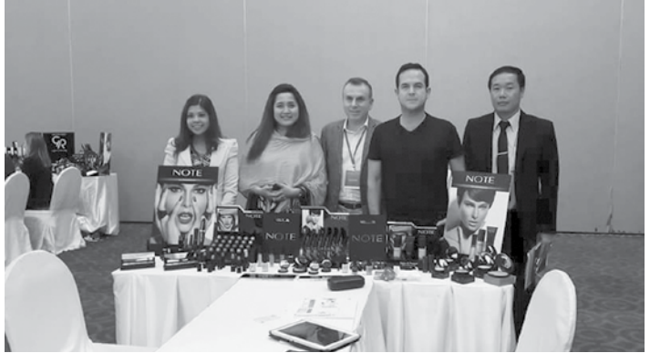
ရေးလုပ်ငန်းရှင်များ တက်ရောက်ခဲ့ကြပြီး ၂၀၁၆ ခုနှစ် မေလ ၂၀-၂၂ ရက်နေ့တွင် ရန်ကုန်မြို့ Myanmar Event Park (MEP) တွင် VEAS Company က Organizer အဖြစ် စီစဉ်ကျင်းပမည့် နိုင်ငံတကာအလှအပဆိုင်ရာ ကုန်ပစ္စည်းပြပွဲ (Beauty Connect Myanmar 2016) တွင်လည်း ကမ္ဘောဒီးယားနိုင်ငံမှ အလှကုန်ပစ္စည်းဆိုင်ရာ ထုတ်ကုန်များကို ဝင်ရောက်ပြသဦးမည်ဖြစ်ကြောင်း သတင်းရရှိပါသည်။

VEAS Professional Event Organizer Company မှ ဒီဇင်ဘာလ ၁ ရက်တွင် ကမ္ဘောဒီးယားနိုင်ငံ ဖန္ဒမ်းပင်မြို့ရှိ ဆိုဖီတယ်ဟိုတယ်၌ Cambodia B2B Business Matching Meeting ကို ကျင်းပပြုလုပ်ခဲ့သည်။