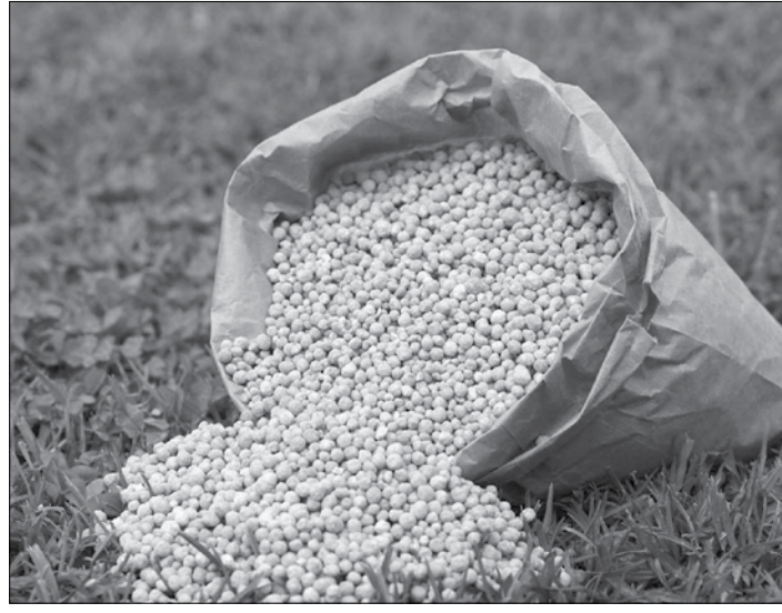
ကိုတိုး-စုစည်းသည်

ဒေသအလိုက် သယ်ယူပို့ဆောင်စရိတ်များအပေါ်တွင် မူတည်၍ ဈေးနှုန်းကွာခြားနိုင်ကြောင်းနှင့် ရည်ညွှန်းဈေးနှုန်းအတိုင်း ရောင်းခြင်းမရှိပါက ယူရီးယား မြေဩဇာ ဝယ်ယူဖြန့်ဖြူးရောင်းချရေး ဦးဆောင်ကော်မတီနှင့် မြန်မာနိုင်ငံမြေဩဇာ မျိုးစေ့နှင့် စိုက်ပျိုးရေးဆေးလုပ်ငန်းမရှင်များ အသင်းသို့ ဆက်သွယ်အသိပေးနိုင်ကြောင်း သိရသည်။