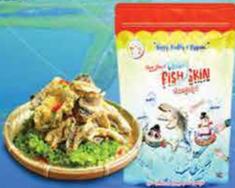
Crispy Fish Skin