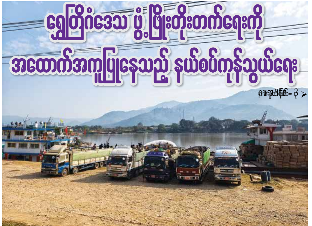
စာမျက်နှာ- 3 >