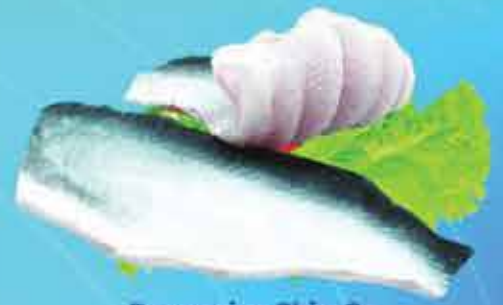
Pangasius Skin On