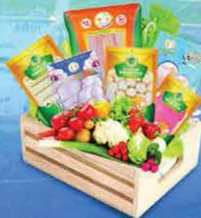
Sausage, Fish Ball, Fish Slice

Pantanaw Township, Ayeyarwady Region. Ph - 09 987 945 549, 09 941 985 196