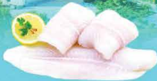
Pangasius Fillet well Trimmed