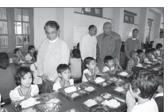
စာမျက်နှာ (၂၉) သို့ >