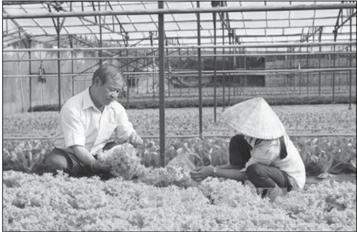
ပြည်နယ်နှင့် မြို့တော်တစ်ခုစီတွင် အဆင့်မြင့်နည်းပညာသုံးလယ်ယာထွက်ကုန်များ၏ ထုတ်လုပ်မှုတန်းဖိုးမှာ ငါးဆပိုမြင့်တက်လာလိမ့်မည်ဟု ခန့်မှန်းထားသည်။ အဆင့်မြင့်နည်းပညာသုံး လယ်ယာထွက်ကုန်များ၏ ဝင်ငွေကိုစိုက်ပျိုးရေးကာလအတွင်း နည်းပညာသုံးသော ထွက်ကုန်များနှင့်

ဗီယက်နမ်နိုင်ငံသည် ၂၀၂၀ ပြည့်နှစ်တွင် လယ်ယာစိုက်ပျိုးရေး လုပ်ငန်း၌ နည်းပညာအဆင့်မြင့် သမဝါယမအသင်း ၅၀၀ ဖွဲ့စည်းပြီး အဆင့်မြင့် နည်းပညာဖြင့် ထုတ်လုပ်သော လယ်ယာစိုက်ပျိုးရေးလုပ်ငန်းတန်းဖိုးကို ငါးဆမြင့်တင်သွားမည်ဖြစ်ကြောင်း လယ်ယာစိုက်ပျိုးရေးနှင့် ကျေးလက်ဖွံ့ဖြိုးရေးဌာနက ထုတ်ပြန်ကြေညာသည်။ သမဝါယမလုပ်ငန်းစုစုပေါင်း၏ ၆၀ ရာခိုင်နှုန်းကို ကုလောင်(မဲခေါင်) မြစ်ဝကျွန်းပေါ်၊ မြစ်နီမြစ်ဝကျွန်းပေါ်၊ မြောက်ပိုင်းတောင်ပေါ်ဒေသနှင့် ထေငှယင်(ဗဟိုကုန်းမြင့်ဒေသ) တို့ကဲ့သို့ သော လယ်ယာစိုက်ပျိုးရေးအဓိက အချက်အချာဒေသများတွင် ဖွဲ့စည်းပေးသွားမည်ဖြစ်သည်။ ပြည်နယ်နှင့် မြို့တော်တစ်ခုစီတွင် အနည်းဆုံးအဆင့်မြင့်နည်းပညာသုံးလယ်ယာစိုက်ပျိုးရေး သမဝါယမအသင်းသုံးသင်းစီ ဖွဲ့စည်းပေးသွားမည်