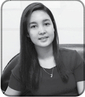
မချိုမာဝင်း

သင်တန်းမှာ ထူးချွန်တဲ့ သင်တန်းသူ၊ သင်တန်းသားတွေကို ထိုင်းနဲ့ဂျပန်နိုင်ငံတွေကို နှစ်စဉ် လေ့လာရေးခရီးစဉ်အဖြစ် စေလွှတ်တာတွေလည်း ရှိပါတယ်။ လက်တွေ့လုပ်ငန်းခွင်မှာလည်း အမှန်တကယ်ပြန်လည်အသုံးချလို့ရတဲ့ အကြောင်းအရာတွေကို လေ့လာခွင့်ရရှိခဲ့ပါတယ်။ ကုန်သွယ်စီးပွားရေးလောကမဟုတ်ဘဲ အပြင်လူ (ဆရာဝန်) တစ်ယောက်ဖြစ်တဲ့ ကျွန်တော်တောင် ကုန်သွယ်စီးပွားနဲ့ပတ်သက်တဲ့ knowledge တွေ တော်တော်ရလိုက်ပါတယ်။ ကုန်သွယ်စီးပွားရေးလုပ်ငန်း လုပ်ကိုင်နေသူတွေနဲ့ ကုန်သွယ်ရေးကို စိတ်ဝင်စားသူတွေအနေနဲ့ ဒီသင်တန်းကို တက်ရောက်သင့်တယ်လို့ အကြံပြုလိုပါတယ်။