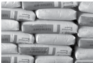
ဘိလပ်မြေအဝင်ပိုခဲ့ပါသည်။

မော်လမြိုင်ဘိလပ်မြေဈေးကွက် မှာ အရောင်းအဝယ်ပုံမှန်ရှိပြီး ဈေးငြိမ် တယ်လို့ အိမ်ဆောက်ပစ္စည်းရောင်း ဝယ်ရေးဆိုင်မှ တာဝန်ရှိသူတစ်ဦးက ပြောပါတယ်။