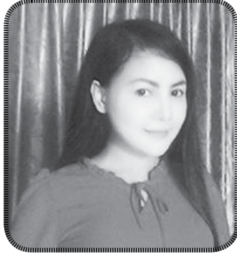
မနန်းပပလွင်

ကုန်သွယ်မှုဆိုင်ရာပညာရပ်တွေကို ဆက်လက်ဆည်းပူးလေ့လာနိုင်ဖို့ TTIအနေနဲ့ ဒီပလိုမာဘွဲ့သင်တန်းတွေ ဖွင့်လှစ်သင်ကြားပေးနိုင်ဖို့ကိုလည်း မျှော်လင့်မိပါတယ်။ ဒီသင်တန်းကို တက်ရောက်ခဲ့ကြတဲ့ သင်တန်းသူ၊ သင်တန်းသားများအနေနဲ့ ကုန်သွယ်ရေးအတတ်ပညာ၊ ဗဟုသုတတွေသာမက ရင်းနှီးတွေ့ဆုံ ခင်မင်မှုတွေကိုလည်း ရရှိခဲ့ကြပါတယ်။