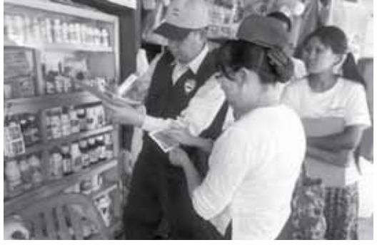
ပျော်စရာဆိုင်ရုံနှင့်ဆိုင်များတွင် ဆေးပစ္စည်းနှင့် ဆေးအရောင်းဆိုင်များအား ရှောင်တင်ကွင်းဆင်းစစ်ဆေးနေကြသည်။

q u i v u f i " m v b a j r h b Z n E S h y h o w b a q; t a & m i f q u i f o h q u i f t m; O i h a m u p p a q; & m q u i f E f f a q i f v h f x l v l u e f r u p b o u l v r f u l e q u i f u f y g a o m y h o w f a q; r s; ? o u l v r f v e h a o m y h o w b a q; r s; a w & h o j z i h w m j r p b o f q n f c h y D y h o w b a q; A l c h x l y l y h y p a f a y: w f i y h o w b a q; E S h y w b u b o n h o w i f t c s u f t v u f r; y h o w b a q; u i f y g o f i f j r i f r m; v m & o n i t a L u m i f i f r s; o h o l e n f r s; E S h o l p e f t r i e f