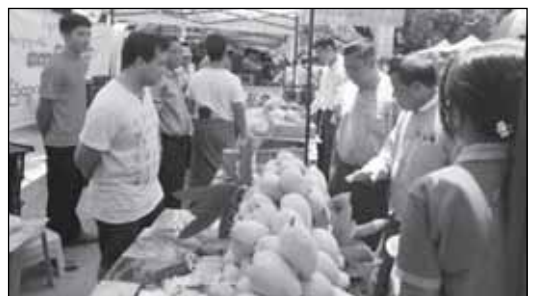
မွတ္တလေးမြို့တွင် ပထမအကြိမ် မြန်မာ့သရက်သီး ဈေးရောင်းပွဲတော်ကျင်းပနေကြသူများ