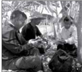
ရခိုင်ငှက်ပျောနှင့် ရွှေငှက်ပျောများကို စိုက်ပျိုးရာတွင် အသုံးပြုနေကြသူများ