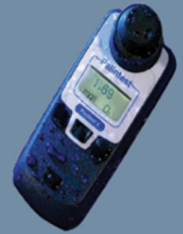
Parlinter Water Testing Equipment