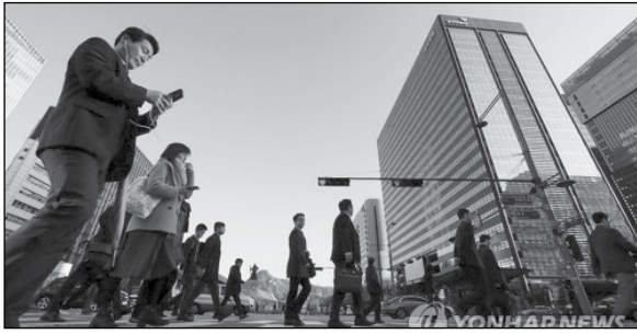
ဝန်ထမ်းများဖြစ်သည်။ အားလုံးခြုံငုံသုံးသပ်မည်ဆိုပါက ရုံးဝန်ထမ်းများအနက် ယမ်းမျှ ၄၈ ဒသမ ၁ ရာခိုင်နှုန်းမှာ အလုပ်မှအချိန်အတိအကျ ပြန်ကြသည်။

BC card ကုမ္ပဏီသည် အကြွေး ကတ်သုံးစွဲသူဖောက်သည် ၂၁၀၀၀၀ နီး သုံးစွဲမှုပုံစံကို ယခုနှစ်စက်တင်ဘာမှ စ၍ ခြောက်လကြာ လေ့လာပြီးနောက် ယခုကဲ့သို့ တွေ့ရှိရခြင်းဖြစ်သည်။ အကြွေးကတ်သုံးစွဲသူဖောက်သည်များမှာ ရုံးလုပ်သားများဖြစ်ပြီး အသက်အရွယ်အားဖြင့် သုံးဆယ်ကျော်၊ လေးဆယ်ကျော်နှင့် ၅၀ ကျော်ဝန်းကျင်