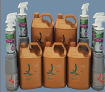
Lochlor Spa Chemicals