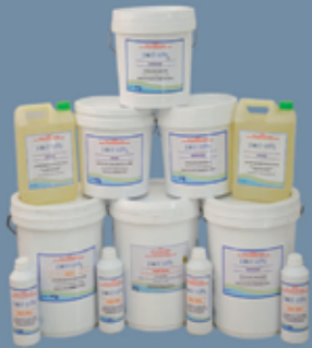
Pool Safe Swimming Pool Chemicals