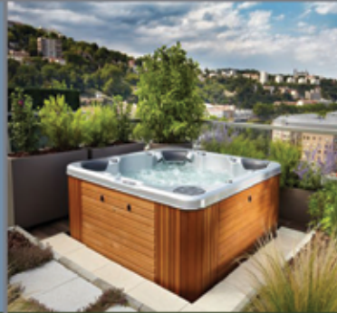
Sapphire Spa's & Swim Spa's