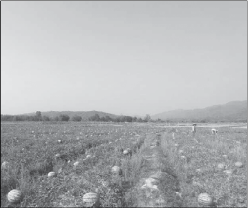
ဖြင့် ကျပ် ၆၂၄၀၀၀ ရရှိမှာဖြစ်ပါတယ်။ ဒါကြောင့်အနည်းဆုံး တစ်ဧက လျှင် ၁၀ တန်ခန့်ထွက်ရှိသဖြင့် တစ်ဧကလျှင် ကျပ် ၆၂၄၀၀၀ ရရှိမည်ဖြစ်သဖြင့် ကားခ၊ လုပ်အားခ၊ အထွေထွေကုန်ကျစရိတ်များနုတ်ပါက ဖရဲစိုက်ဧက တစ်ဧကလျှင် ဖရဲစိုက်တောင်သူများအတွက် ကျပ်သိန်းလေးဆယ်ခန့် အကျိုးအမြတ်များ ရရှိခဲ့ကြတဲ့အတွက် ကချင်ပြည်နယ်က ဖရဲစိုက်တောင်သူတွေ အကျိုးအမြတ်များများရတဲ့နှစ်ဖြစ်ကြောင်း သိရှိရပါသည်။

လွယ်လှယ်နယ်စပ်ကုန်သွယ်ရေးစခန်းမှ ကချင်ပြည်နယ် ဗန်းမော်၊ မိုးမောက်တစ်ဝိုက်တွင် စိုက်ပျိုးထွက်ရှိခဲ့သော ဖရဲသီးများအား ၂၀၁၈ ခုနှစ် ဧပြီ ၁ ရက်မှ ၃၀ ရက်အတွင်း တန်ချိန် ၃၈၆၈၅ တန်၊ တန်ဖိုးအားဖြင့် အမေရိကန်ဒေါ်လာ ၄ ဒသမ ၁၃၈ သန်းဖိုး တင်ပို့နိုင်ခဲ့ပြီး ကာလတူ ၂၀၁၇ ခုနှစ် ဧပြီလတွင် တန်ချိန် တန် ၃၃၀၆၀၊ တန်ဖိုးအားဖြင့် အမေရိကန်ဒေါ်လာ ၃ ဒသမ ၅၄၂ သန်းသာ တင်ပို့နိုင်ခဲ့သဖြင့် ကာလတူထက် ယခုနှစ်ဧပြီလတွင် တန်ချိန် ၅၆၂၅ တန်နှင့် တန်ဖိုးအားဖြင့် အမေရိကန်ဒေါ်လာ သုည ဒသမ ၅၉၆ သန်း ပိုမိုတင်ပို့နိုင်ခဲ့ကြောင်း သိရှိရပါသည်။ ဈေးနှုန်းအနေနှင့်လည်း ဖရဲအကြားသီး တစ်တန်လျှင် တရုတ်ယွမ် ၃၀၀၀ - ၃၅၀၀ ခန့်ရရှိခဲ့ပြီး ဂျပန်ဖြင့်ထည့်၍ ရောင်းချသောဖရဲသီးများမှာ တစ်တန်လျှင် ယွမ် ၄၀၀၀ ခန့်အထိ ဈေးနှုန်းရရှိခဲ့ကြပါသည်။ ဖရဲတစ်ဧကစိုက်ပျိုးလျှင် စိုက်ပျိုးစရိတ်ကျပ်သိန်း ၂၀ ခန့်ကျန်ကျပြီး အထွက်နှုန်းမှာတစ်ဧကလျှင် ၁၀ တန်မှ ၁၂ တန်ကြားထွက် ရှိတာကြောင့် ငွေလဲနှုန်းတစ်ယွမ်လျှင် မြန်မာ ငွေ ၂၀၈ ကျပ်ဖြင့် ထွက်ချက်ပါက ရောင်းဈေးပျမ်းမျှ တစ်တန် လျှင် ယွမ် ၃၀၀၀ ရရှိမှာဖြစ်ပြီး မြန်မာကျပ်ငွေအား LWEJELMg