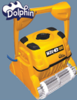
Dolphin Robotic Pool Cleaners