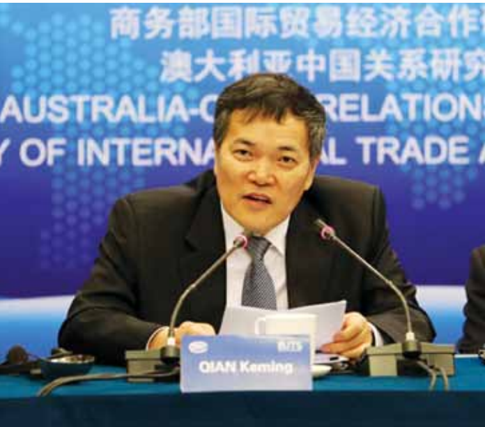
ဆောင်ရွက်ခဲ့ကြလို့ဖြစ်ပါတယ်”ဟု Qian က ထပ်မံပြောကြားခဲ့သည်။ ယခုနှစ်ကျင်းပမည့် (၁၄)ကြိမ်မြောက် တရုတ်-အာဆီယံ ကုန်စည်ပြပွဲ (China-ASEAN Expo, 2017)ကို စက်တင်ဘာ ၁၂ ရက်မှ ၁၅ရက်အထိ တရုတ် နိုင်ငံတောင်ပိုင်းရှိ ကွမ်းရှီးကျွန်းကိုယ်ပိုင်အုပ်ချုပ်ခွင့်ဒေသတွင် ကျင်းပမည်ဖြစ် သည်။ ယခုနှစ်ကျင်းပမည့် ကုန်စည်ပြပွဲ၏ဆောင်ပုဒ်မှာ “၂၁ ရာစုရေးကြောင်း ပိုးလမ်းမကြီးတွင် ပူးပေါင်းပါဝင်တည်ဆောက်ရေး၊ ခရီးသွားလုပ်ငန်းနှင့်အတူ ဒေသတွင်းစီးပွားရေးလုပ်ငန်းများ ဖွံ့ဖြိုးတိုးတက်လာစေရေး”ဟုရှိကြောင်းဖြစ်သည်။

ကုန်သွယ်ရာမှာ အကြီးဆုံးသော ကုန်သွယ်ဖက်အနေနဲ့ ဆက်လက် ရပ်တည်သွားမှာဖြစ်ပါတယ်။ အာဆီယံဟာ တရုတ်နိုင်ငံရဲ့ တတိယမြောက် ကုန်သွယ်ဖက်နိုင်ငံဖြစ်သလို တရုတ်နိုင်ငံရဲ့ စတုတ္ထမြောက် အကြီးမားဆုံး ပို့ကုန်တင်ပို့ရာ ဒေသလည်းဖြစ်ပါတယ်။ ဒါ့အပြင် အာဆီယံဒေသက ကုန် ပစ္စည်းတွေကို ဒုတိယမြောက် အများဆုံး တင်သွင်းနေတဲ့ နိုင်ငံလည်းဖြစ်ပါတယ်”ဟု Qian က သတင်းစာရှင်းလင်းပွဲ တွင် ပြောကြားခဲ့သည်။ တရုတ်နှင့် အာဆီယံဒေသတွင်း နိုင်ငံများအကြား ကုန်သွယ်မှုသည် တစ်နှစ်ထက်တစ်နှစ် မြင့်တက်လျက်ရှိရာ ယခုနှစ် ပထမဇယားအတွင်း ကုန်သွယ်မှုသည် ၁၆ ဒသမ ၂ရာခိုင်နှုန်းမြင့်တက်ခဲ့သည်ဟုဆိုသည်။ “ဒီရလဒ်ဟာ တရုတ်နဲ့ အာဆီယံတို့အကြား နိုင်ငံရေး အရ ယုံကြည်မှုတည်ဆောက်နိုင်ခဲ့ခြင်းနဲ့ ပူးပေါင်းဆောင် ရွက်မှုများ ခိုင်မာစေခဲ့လို့ ဖြစ်ပါတယ်။ တရုတ်-အာဆီယံ ကုန်စည်ပြပွဲကိုလည်း အကောင်းမြင်ဝါဒနဲ့ ပိုင်းဝန်းပူးပေါင်း