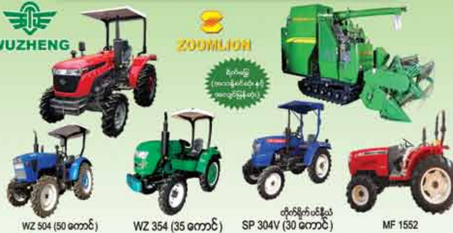
WZ 504 (50 ကောင်)