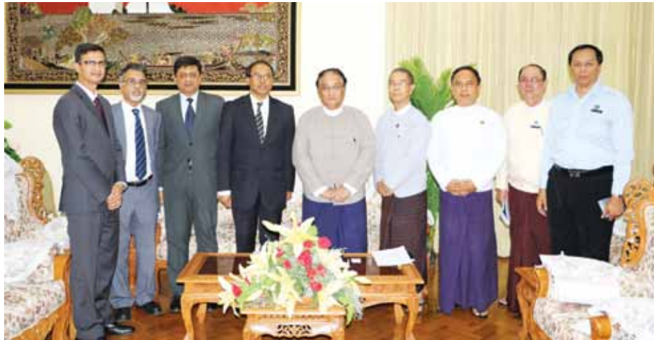
အကြား ချိတ်ဆက်ဆောင်ရွက်နိုင်ရေး၊ မြန်မာနိုင်ငံရှိ ဆိပ်ကမ်းများနှင့် ဘင်္ဂလားဒေ့ရှ်ဆိပ်ကမ်းများအကြား တိုက်ရိုက်ပို့ဆောင်နိုင်ရေးတို့နှင့် စပ်လျဉ်း၍ ဆွေးနွေးခဲ့ကြသည်။

ထိုသို့တွေ့ဆုံရာတွင် နှစ်နိုင်ငံ ကုန်သွယ်မှုတိုးမြှင့်ရေးအတွက် အစိုးရအချင်းချင်း (G to G) သော်လည်းကောင်း၊ ပုဂ္ဂလိကလုပ်ငန်းရှင်များအချင်းချင်း (B to B) သော်လည်းကောင်း ပူးပေါင်းဆောင်ရွက်နိုင်ရေး၊ နယ်စပ်ကုန်သွယ်မှုအသစ်များ ပင်လယ်ရေကြောင်းမှပင် တိုးမြှင့်တင်ပို့နိုင်ရေးအတွက် ဆန်းစစ်ချက်နှင့် ရေထွက်ကုန်ပစ္စည်းများကို တစ်ဆင့်ခံ ရောင်းချနေမည့်အစား တိုက်ရိုက်ဆက်သွယ် ဆောင်ရွက်နိုင်ရေးအတွက် ပုဂ္ဂလိကအဖွဲ့အစည်းများအား အားပေးသွားနိုင်ရေး၊ နှစ်နိုင်ငံ ကုန်သည်လုပ်ငန်းရှင်များ