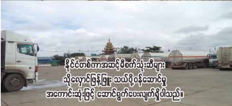
နိုင်ငံတစ်ကားအဆင့်ပိစက်သုံးဆီများ သိုလှောင်ဖြန့်ဖြူး သယ်ပို့ဝန်ဆောင်မှု အကောင်းဆုံးဖြင့် ဆောင်ရွက်ပေးလျက်ရှိပါသည်။