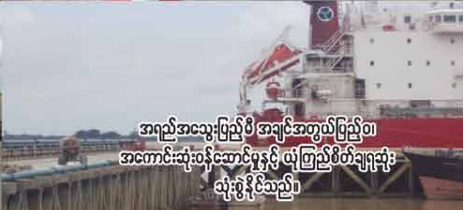
အရည်အသွေးပြည့်မီ အချင်အတွယ်ပြည့်ဝ၊ အကောင်းဆုံးဝန်ဆောင်မှုနှင့် ယုံကြည်စိတ်ချရဆုံး သုံးစွဲနိုင်ပါသည်။