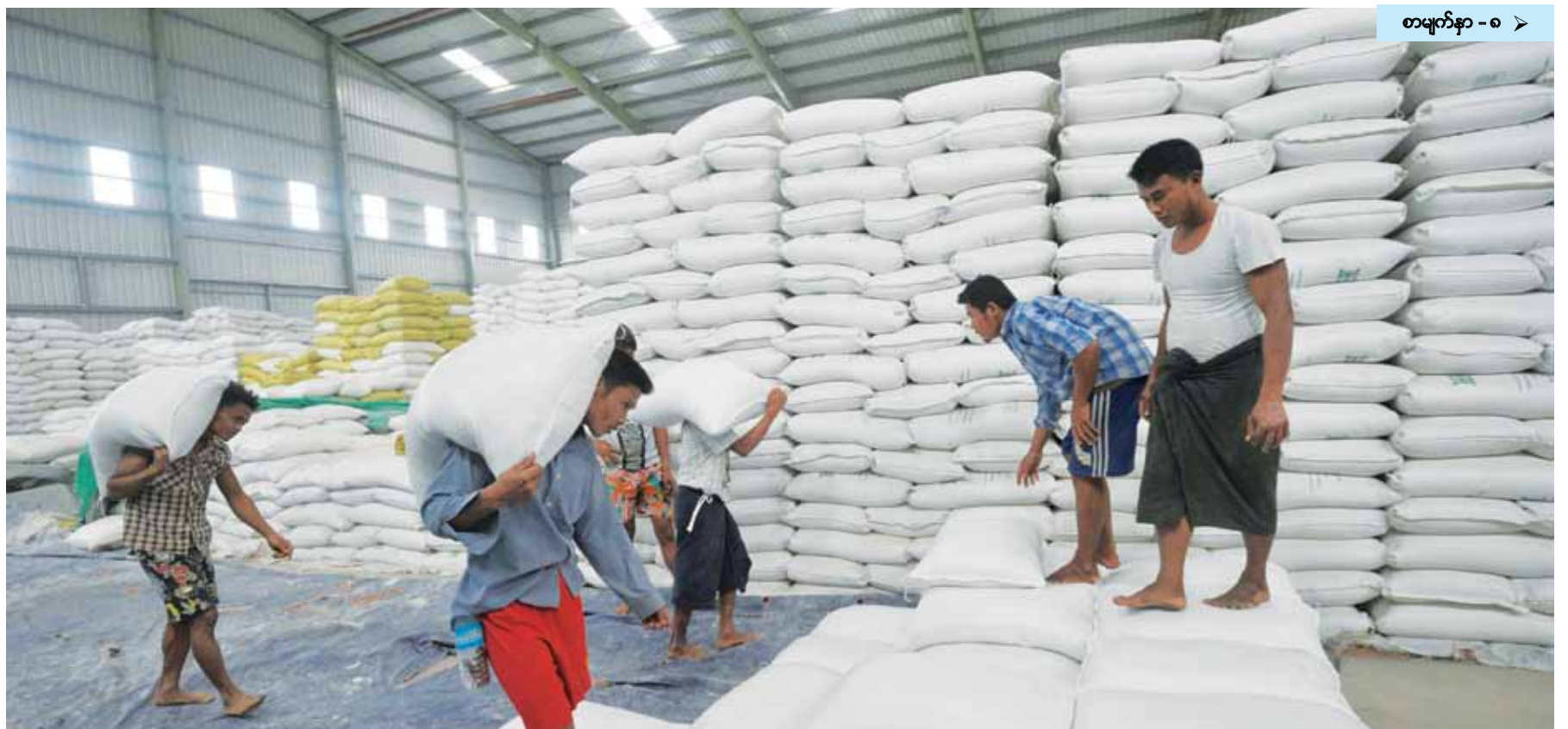
စာမျက်နှာ - ၈ >

အမေရိကန်နိုင်ငံသို့ တင်သွင်းမည့် Siluriformes fish and fish products များကို အမေရိကန်နိုင်ငံ အစားအစာ ဘေးအန္တရာယ် ကင်းရှင်းရေးနှင့် စစ်ဆေးရေး လုပ်ငန်းမှ ပြန်လည်စစ်ဆေးမည့် ကြေညာချက်ထုတ်ပြန် စာမျက်နှာ - ၁၅ >