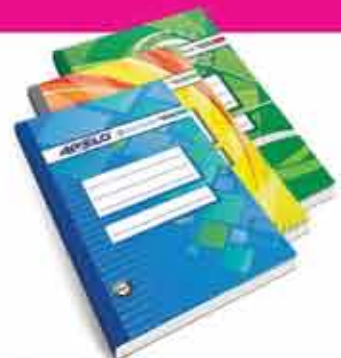
APOLO ACCOUNTING BOOKS