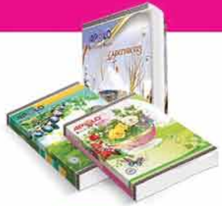
APOLO BINDING BOOKS