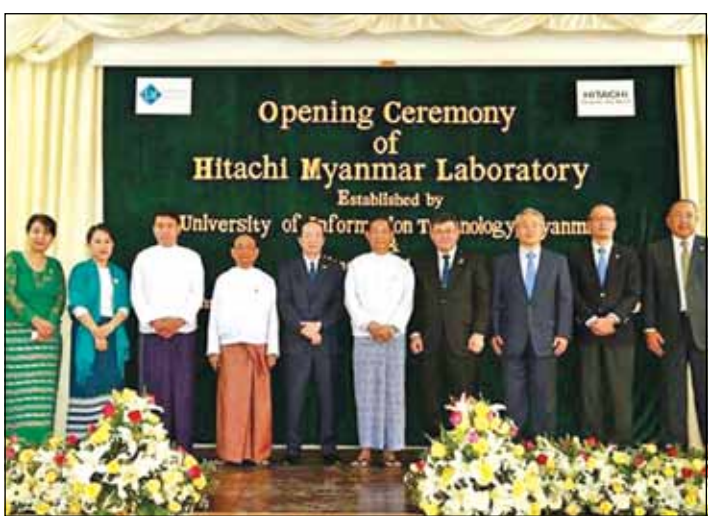
လမ်းများနှင့် ဆက်သွယ်ရေးကဲ့သို့သော လူမှုရေးဆိုင်ရာ အခြေခံလိုအပ်ချက်များကို ရင်းနှီးမြှုပ်နှံဆောင်ရွက်နေသည်သာမက ဘဏ္ဍာရေးနှင့် ကမ္ဘာလှည့်ခရီးသွားလုပ်ငန်းကဲ့သို့သော အခြားလုပ်ငန်းများတွင်လည်း ရင်းနှီးမြှုပ်နှံမှုများကို တိုးမြှင့်လုပ်ဆောင်လျက်ရှိသည်။

အရှေ့တောင် အာရှနိုင်ငံများအနက် မြန်မာနိုင်ငံသည် စီးပွားရေးတိုးတက် ကောင်းမွန်စေရန် ဆောင်ရွက်လျက်ရှိရာ လျှပ်စစ်မီး၊ မီးရထား