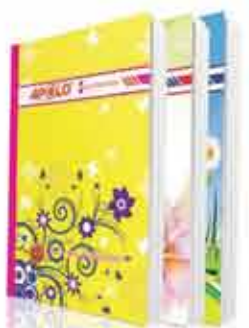
APOLO HARD COVER BOOKS