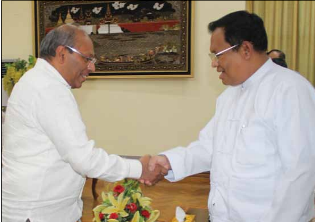
ပူးတွဲဖိုရမ် (Joint Trade and Investment Forum – JTIF) မြန်မာ့ရင်းနှီးမြှုပ်နှံမှုပြပွဲ (Myanmar Investment Road Show – MIRS) နှင့် 3 rd India-

အဆိုပါတွေ့ဆုံပွဲတွင် ပြည်ထောင်စုဝန်ကြီးက မြန်မာ-အိန္ဒိယနှစ်နိုင်ငံအကြားကုန်သွယ်မှုနှင့် ရင်းနှီးမြှုပ်နှံမှုတိုးတက်ရေး၊ ဒုတိယအကြိမ်မြောက် မြန်မာ-အိန္ဒိယ နယ်စပ်ဈေးပွဲတွဲကော်မတီ အစည်းအဝေး ကျင်းပရေးနှင့် ၂၀၁၆ ခုနှစ်တွင် နယ်စပ်အရာရှိများအစည်းအဝေး ကျင်းပနိုင်ရေးတို့အတွက် ဆောင်ရွက်နေမှု အခြေအနေများကို ဆွေးနွေးခဲ့ပြီး သံအမတ်ကြီးကလည်း ၂၀၁၆ ခုနှစ်၊ ဇန်နဝါရီလအတွင်း အိန္ဒိယနိုင်ငံ၊ ချင်နိုင်းမြို့တွင် ကျင်းပပြုလုပ်မည့် ဒုတိယအကြိမ် မြန်မာ-အိန္ဒိယ ကုန်သွယ်ရေးနှင့်ရင်းနှီးမြှုပ်နှံမှု