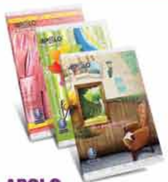
APOLO EXERCISE BOOKS