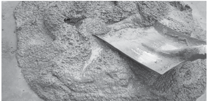
သီတာဝင်း (DOT) စုစည်းသည်

မန္တလေးဈေးကွက်မှာ ဘိလပ်မြေက ပွင့်လင်းရာသီကြောင့် အရောင်း အဝယ် လိုက်တယ်။ အဝင်အထွက်မျှနေတာကြောင့် ဈေးကငြိမ်တယ်လို့ သိရပါတယ်။ ဈေးကွက်ထဲ အရောင်းအဝယ်ဖြစ်နေတဲ့ဈေးမှာ အေသုံးလုံး ၅၃၀၀ ကျပ်၊ မြန်မာ ဆင် ၄၆၀၀ ကျပ်၊ ဆင်မင်း(ကျောက်ဆည်) ၄၇၀၀ ကျပ်၊ ကျားခေါင်း၄၆၀၀ ကျပ်၊ မြင်းခေါင်း၄၆၀၀ကျပ်၊စိန် ၆၈၀၀ကျပ်၊ဆင်၆၉၀၀ကျပ်နဲ့အရောင်းအဝယ်ဖြစ်တယ်လို့ ဘိလပ်မြေအရောင်းဆိုင်မှ စုံစမ်း သိရှိခဲ့ပါတယ်။