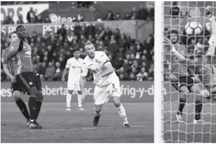
လာမည်ဖြစ်သည်။

အဆိုပါသဘောတူစာချုပ်အရ PPTV သည် ၂၀၁၉-၂၀ ဘောလုံးရာသီမှ စတင်အသက်ဝင်မည်ဟုဆိုသော်လည်း ပရီးမီးယားလိဂ်ပြိုင်ပွဲကျင်းပရေးကော်မတီကမူ အတိအလင်း သတင်းထုတ်ပြန်ခြင်း မပြုသေးကြောင်း အဆိုပါ သတင်းတွင်ဖော်ပြထားသည်။ ယင်းစာချုပ်အား ပရီးမီးယားလိဂ်က အတည်ပြု ထုတ်ပြန်ကြေညာခဲ့ပါက PPTVသည် ပရီးမီးယားလိဂ်တွင် တန်ကြေးအများဆုံးရုပ်သံလွှင့်လုပ်ငန်း ဖြစ်