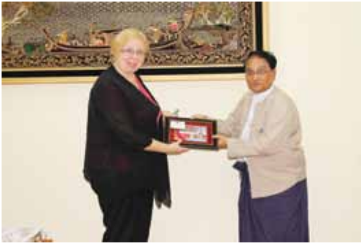
ဝန်ကြီးဌာန၊ ညွှန်ကြားရေးမှူးချုပ်များနှင့် တာဝန်ရှိပုဂ္ဂိုလ်များ တက်ရောက်ခဲ့ကြကြောင်း သတင်းရရှိသည်။ MOC (IR)

စီးပွားရေးနှင့် ကူးသန်းရောင်းဝယ်ရေးဝန်ကြီးဌာန၊ ပြည်ထောင်စုဝန်ကြီး ဒေါက်တာသန်းမြင့်သည် နိုဝင်ဘာလ ၁၈ ရက် နံနက် ၁၀ နာရီ၌ ပြည်ထောင်စု သမ္မတမြန်မာနိုင်ငံတော်ဆိုင်ရာ လစ်သူယေးနီးယားနိုင်ငံသံအမတ်ကြီးအဖြစ် ခန့်အပ်ပြီးဖြစ်သော ပေကျင်းမြို့အခြေစိုက် လစ်သူယေးနီးယားနိုင်ငံ သံအမတ်ကြီး H.E. Ms. Ina Marciulionyte အား ဝန်ကြီးရုံးဧည့်ခန်းမ၌ လက်ခံတွေ့ဆုံသည်။