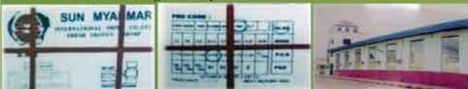
Packed Product Front And Back