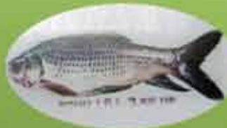
Prawns And Rohu Fish