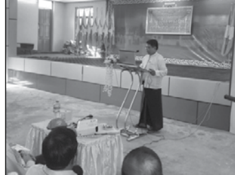
ဆောင်ရွက်နေမှုများနှင့်စားသုံးသူအကာအကွယ်ပေးရေးအသင်းများဖွဲ့စည်းမှုနှင့် စားသုံးသူနစ်နာမှု တိုင်ကြားစာပုံးများထားရှိမှုနှင့် တိုင်ကြားမှု ဖြေရှင်းမှု