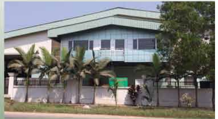
ဆန်နှင့် ဆန်ထွက်ပစ္စည်း ကြိတ်ခွဲရောင်းဝယ်ရေး