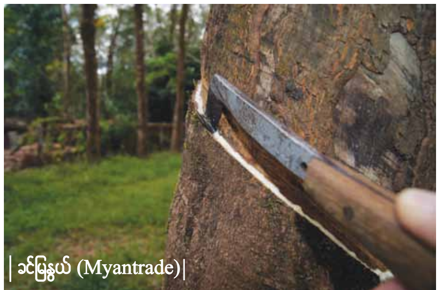
| သင်မြနွယ် (Myantrade) |

ရသလို အပင်အိုသွားချိန်မှာလည်း သစ်အဖြစ် အသုံးပြုနိုင်ပါတယ်။ ရော်ဘာသစ်နဲ့ သစ်ခွဲသား တွေ ပြုလုပ်ပြီး ပြည်ပသို့ တင်ပို့ရောင်း ချလို့ရသလို အချောထည်ကုလားထိုင်များ၊ စားပွဲများ စတဲ့ ပရိ ဘောဂပစ္စည်းများ ပြုလုပ်ကာ ပြည်ပသို့ တင်ပို့ ရောင်းချလျက်ရှိကြောင်း MOS ရော်ဘာသစ် အချော ထည်ထုတ်လုပ်ရေးစက်ရုံမှ တာဝန်ရှိသူ တစ်ဦးက ပြောပါတယ်။