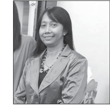
မယဉ်ချောစုတင်မြင့်

Registration & Extension, Exporter & Importer Licences & Application, နိုင်ငံတကာမှ ဈေးကွက် ရှာဖွေမှုပုံစံ၊ Sale Contract, Incoterms, FDA Certificate, Customs နဲ့ ပတ်သက်တဲ့ လုပ်ထုံး လုပ်နည်းများ၊ Business Law, Business Ethics, Market Research နှင့် Logistics တို့ကိုသင်ကြားပေး ခဲ့ပါတယ်။ ဒါ့အပြင် SME Development, Stock Exchange တို့ကိုလည်း သင်ကြားပေးခဲ့ပါတယ်။ သင်တန်းမှာ လစဉ် Business talk ကိုလည်း ပညာရေးနှင့် စီးပွားရေးလောကမှ အထင်ကရ ဆရာကြီးများ ကို ဖိတ်ကြားပြီး လာရောက်ဟော ပြောသင်ကြားပေးတဲ့အတွက် စီးပွားရေး စိတ်ကူး အကြံအစည်တွေ၊ နိုင်ငံတကာမှာ လုပ်ကိုင် ဆောင် ရွက်နေတဲ့ စီးပွားရေးအကြောင်းတွေ၊ အသိဉာဏ် တွေရရှိခဲ့ပါတယ်။ Business Trip မှလည်း Export Quality လုပ်ကိုင်ဆောင်ရွက်လျက်ရှိတဲ့ လုပ်ငန်း များ၊ စက်ရုံများ၊ ဆိပ်ကမ်းကြီးများ၊ နယ်စပ် ကုန် သွယ်ရေးစခန်းများသို့ သွားရောက်လေ့လာရတဲ့ အပြင် ဌာနဆိုင်ရာအသီးသီးမှ တတ်သိပညာရှင် တွေ၊ စီးပွားရေးနယ်ပယ်မှ ပညာရှင်၊ သင်တန်း ဆရာ၊ ဆရာမများနှင့် သင်တန်းသားစီးပွားရေး လုပ်ငန်းရှင်များ၊ ဝန်ထမ်းများ၊ ကျောင်းသား ကျောင်းသူများ စသည်ဖြင့် အဆက်အသွယ် ကွန်ရက်တစ်ခု (Network) ရရှိနိုင်ခဲ့ပါတယ်။ ဒီသင်တန်းတက်ရောက်ပြီးတဲ့ နောက်ပိုင်း မှာ ကိုယ်တိုင်ကုမ္ပဏီထူထောင်ကာ ပြည်ပမှ Supplier ရှာတာ ဆေးဝါးတင်သွင်းဖို့ လုပ်ဆောင်ခဲ့ပါတယ်။ ပထမဆုံးအနေနဲ့ အိန္ဒိယမှ ဆေးဝါး စက်ရုံများနှင့် ချိတ်ဆက်ကာ အိန္ဒိယကို သွားရောက်ပြီး ဆေးဝါး စက်ရုံများကို လေ့လာခဲ့ပါတယ်။ ပြီးတဲ့နောက်မှာ မြန်မာနိုင်ငံ အစားအသောက်နှင့် ဆေးဝါး ကွပ်ကဲ ရေးဦးစီးဌာန (FDA) မှာမှတ်ပုံတင်ပြုလုပ်ပြီး တင်သွင်း ဖြန့်ဖြူးရောင်းချနေပါပြီ။ ဒါ့ကြောင့် ဒီသင်တန်းကို တက်ရောက်ပြီး လက်တွေ့လုပ်ကိုင် ဆောင်ရွက်နိုင်ခဲ့ပါတယ်။