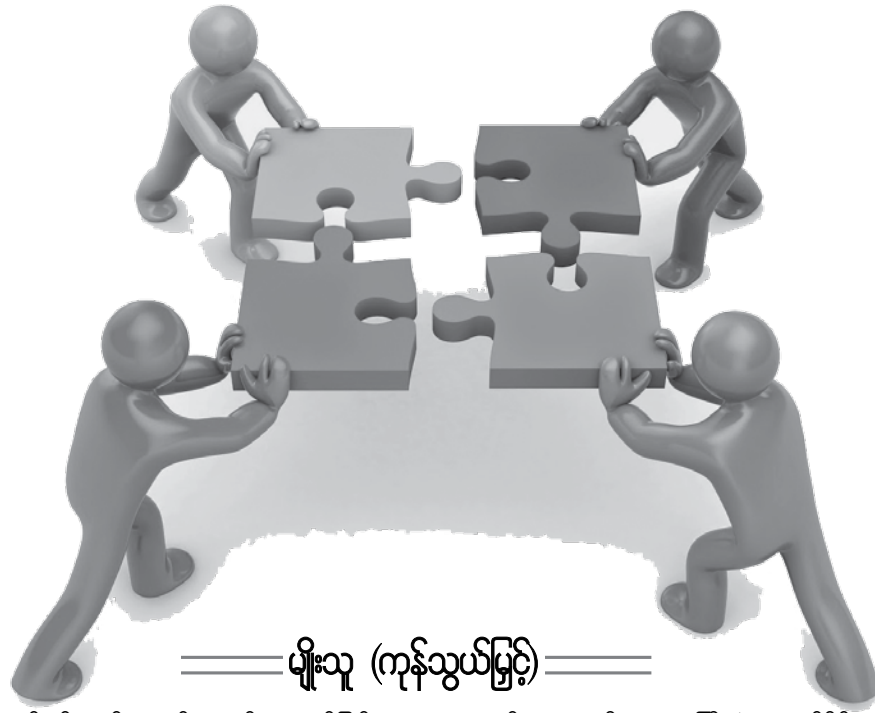
မျိုးသူ (ကုန်သွယ်မှု)

ကြိုးစားရန် လိုအပ်သည်ဟု လူတိုင်းနားလည်ကြပါတယ်။ မကြိုးစားလျှင် ဘာမှမဖြစ်ဟု ပြောတတ်ကြပေမယ့် တကယ်လိုက်နာမိရဲ့လားဟု မေးကြည့်ပါ။ ကျွန်တော်က ကြိုးစားမှုရဲ့ နောက်မှာလိုက်တဲ့ အလိုအပ်ဆုံးအရာမှာ စဉ်ဆက်မပြတ် ကြိုးစားအားထုတ်မှုလို ပြောချင်ပါတယ်။ ကောက်ရိုးမီးလို ခဏတာသာ တောက်သကဲ့သို့ ကြိုးစားမှုကိုလည်း ကြိုးစားလိုက် ရပ်တန့်လိုက်လုပ်နေလျှင် မည်သို့မျှ အောင်မြင်နိုင်မည် မဟုတ်ပေ။ လိုချင်သော ပန်းတိုင်ကိုလည်း မရောက်နိုင်ပါ။ ကြိုးစားမှုကို အလေ့အကျင့် ဖြစ်လာသည်အထိ ဆောင်ရွက်မှသာ အောင်မြင်မှုကို ရနိုင်မယ်လို့ ယူဆရမှာပါ။