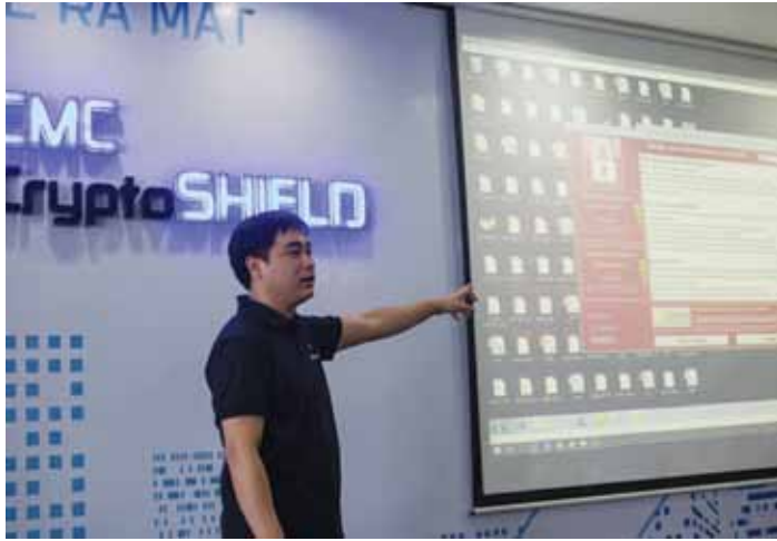
အကြမ်းဖက်တိုက်ခိုက်မှု မခံရအောင် CMC Cryptoshield က ကာကွယ်

Ransomware သည် ပြန်ပေးငွေတောင်းသော ဟက်ကာတို့ကို ခြေရာခံ၍ မရအောင် ခြေရာဖျောက်ပေးနိုင်သော ဆော့ဖ်ဝဲဖြစ်သည်။ ထို့ကြောင့် Ransomware သည် တစ်ကမ္ဘာလုံးကို ခြိမ်းခြောက်လျက်ရှိပြီး ငွေရှာ၍ ကောင်းသော ဆော့ဖ်ဝဲတစ်ခု ဖြစ်ခဲ့သည်။ ကွန်ပျူတာ အသုံးပြုသူ၏ ဒေတာအားလုံးကို လုံခြုံစိတ်ချရပြီး