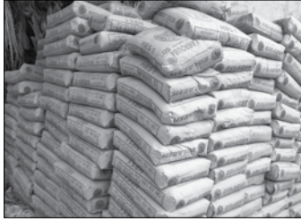
ဧပြီလ ၃၀ ရက်မှ ၂၁ ရက်အထိ နယ်စပ်လမ်းမှ ဘိလပ်မြေအဝင်မှာ တန်ချိန် ၂၄၈၀၀ ကျော်ရှိခဲ့ပြီး ယခင်တစ်ပတ် အဝင်မှာ တန်ချိန် ၁၇၃၉၀ ကျော်ရှိခဲ့တာကြောင့် ဒီတစ်ပတ်မှာ တန်ချိန် ၇၄၄၀ ကျော် အဝင်ပိုခဲ့တယ်လို့ သိရပါတယ်။

ဧပြီလ ၃၀ ရက်မှ မေလ ၆ ရက် အထိ သီတင်းပတ်အတွင်း ပြည်တွင်းသို့ ရေလမ်းမှ ဘိလပ်မြေတန်ချိန် ၈၃၀၀ ကျော်အဝင်ရှိခဲ့ပြီးယခင်သီတင်းပတ်က တင်သွင်းခဲ့တဲ့ တန်ချိန် ၄၇၅၀ ကျော်နဲ့ နှိုင်းယှဉ်ရင် ဒီတစ်ပတ်မှာ တန်ချိန် ၃၅၀၀ ကျော် အဝင်ပိုခဲ့တယ်လို့ သိရပါတယ်။