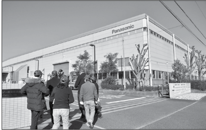
ပညာရှင်များကိုလည်း လေ့ကျင့်ပေး ထုတ်ပေးနိုင်သည်။

စင်ကာပူနိုင်ငံသည် ကျွန်းကျင် ပညာရှင်တို့ ဆုံဆည်းရာ အချက်အချာ ဒေသအဖြစ် နာမည်ရလျက်ရှိသဖြင့် စင်ကာပူတွင် စီးပွားရေးလုပ်ငန်းများ ဆောင်ရွက်နေသော ဂျပန်ကုမ္ပဏီများက စင်ကာပူဝန်ထမ်းများကို လေ့ကျင့်သင်ကြားပေးရန် အစီအစဉ်များ ရေးဆွဲဆောင်ရွက်လျက်ရှိသည်။