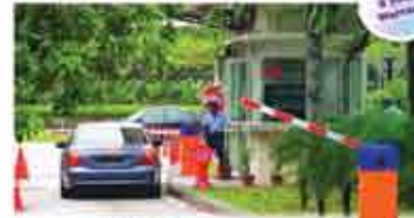
Condo, Super Market, Shopping Center များတွင်အသုံးပြုနိုင်သည့် အီလက်ထရောနစ်စနစ်ပါ Electronic System

ELID FC 1205 CAR PARK ACCESS CONTROL SYSTEM - MICROPROCESSOR BASED CAR PARK ACCESS CONTROL SYSTEM FOR 1 ENTRY AND 1 EXIT. - GUIDED BY THE MENU AND INSTRUCTIONS APPEARING ON THE LCD (EXTREMELY EASY TO PROGRAM) - OFFERS A WIDE RANGE OF READERS ... SUCH AS (MAGNETIC READERS, WIGGANT READERS, PROXIMITY READERS, BAR CODE READERS, SMART CARD READERS)